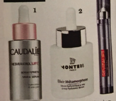
1 CAUDALIE „Resveratrol Lift Firming Serum“, ca. 48 € 2 MONTEIL „Élixir Métamorphose“, ca. 30 € 3 L'ORÉAL „Revitalift Filler Serum“, ca. 18 €