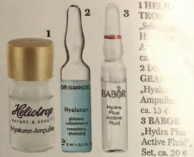
1 HELIOTROP „Solex“ Hyaluron-Ampullen, ca. 13 € 2 DR. GRANDE „glättend, auflockernd, tonisierend, strahlend“ Hyaluron-Ampullen, ca. 13 € 3 BABOR „Hydra Plus Active Fluid“ Set, ca. 20 €