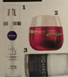
1 NIVEA „Hy Professional Hyaluronic Acid Day Care“, ca. 24 € (exklusiv in den Nivea-Häusern und Spas) 2 GARNIER „Miracle Wake Up Cream“, ca. 10 € 3 V COSMETIC „Women Calming Balm“, ca. 48 €