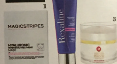
1 MAGICSTRIPES „Intensive Treatment Mask“, ca. 39 € ( www.ausliebezumduft.de ) 2 REXALINE „Hydra Shock Masque“, ca. 40 € (nur bei Douglas) 3 DR. DUVE „Boosting Mask“, ca. 79 €